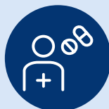
(et d'autres symptômes)